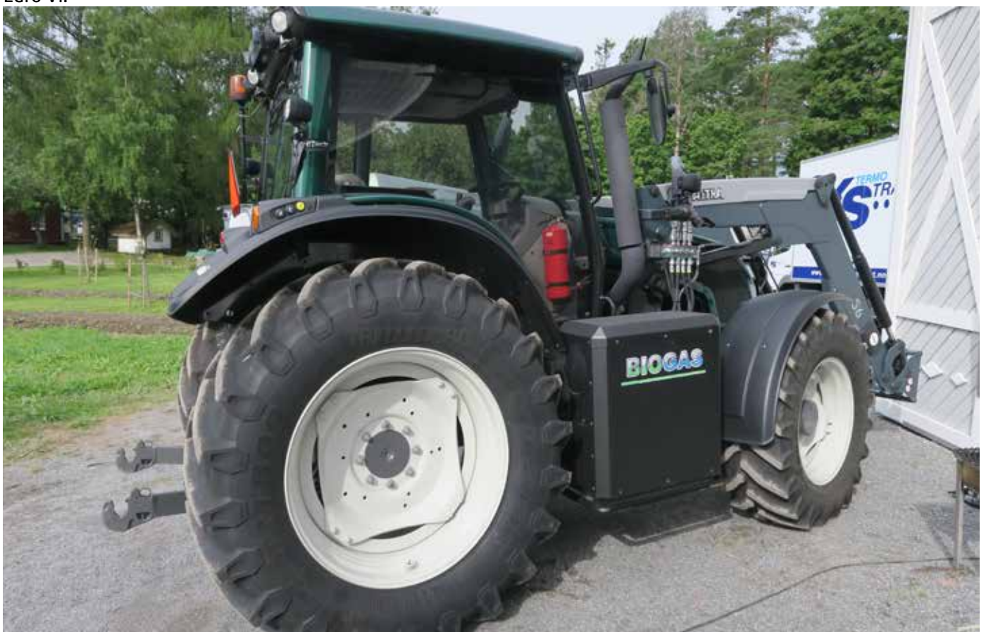
TRAKTOR: Det utvikles også traktorer for biogassdrift.