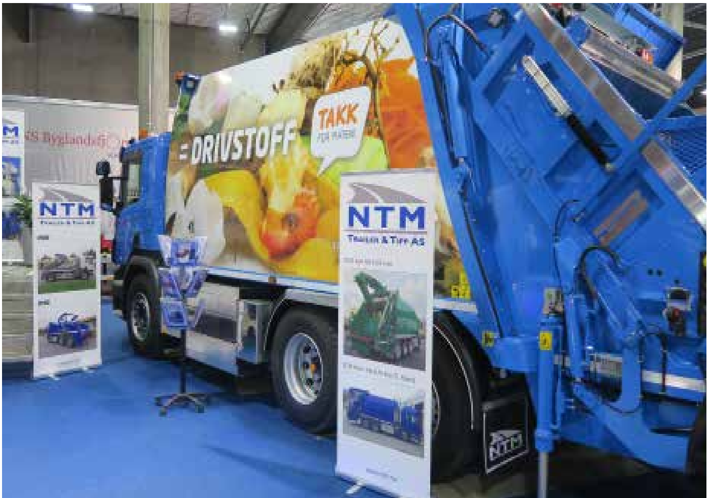
LASTEBILER: Flere produsenter kommer nå med lastebiler med biogass som drivstoff og som oppfyller kravene i Euro VI.