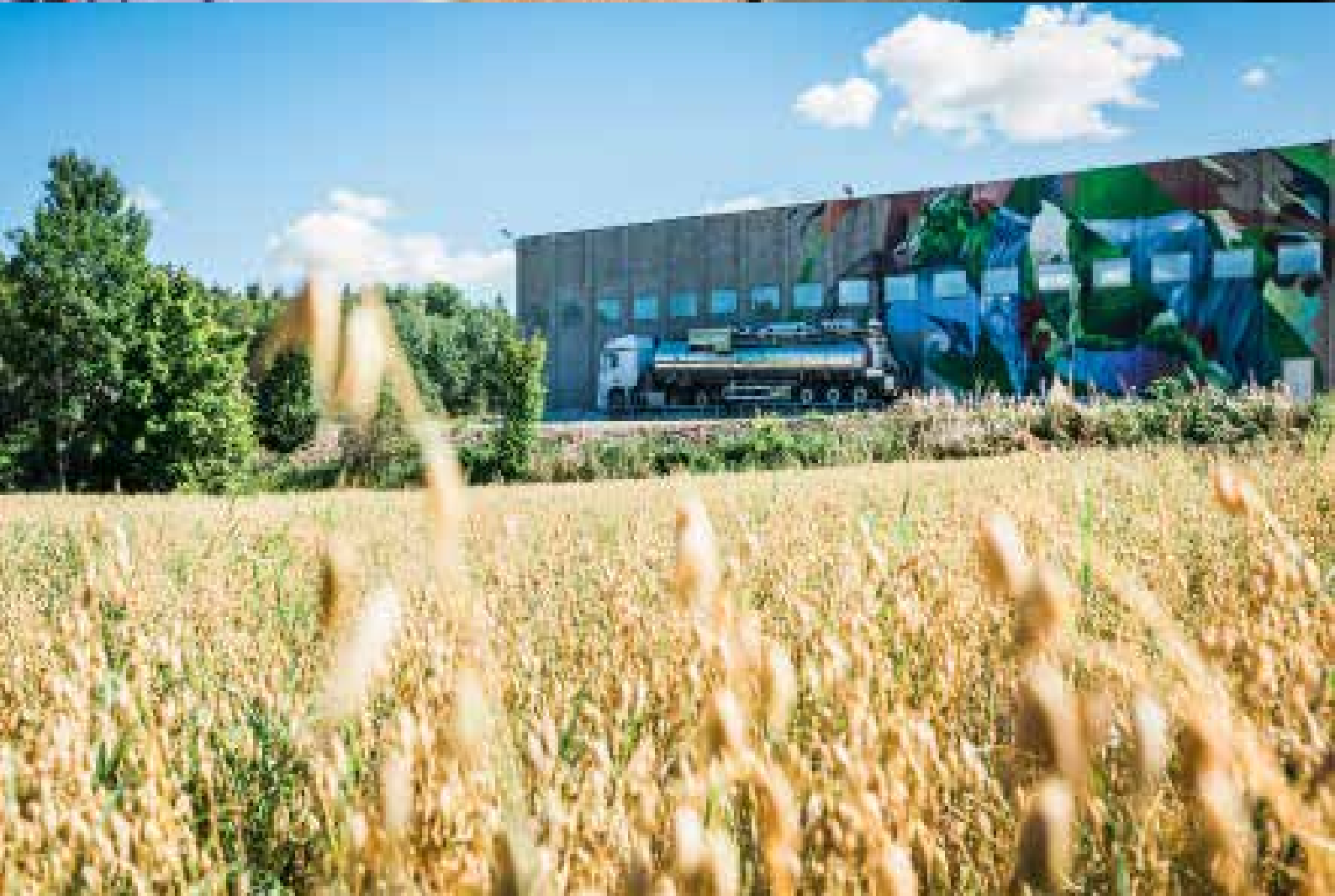
TRANSPORT: I Tønsberg er det bygget opp et effektivt transportsystem for henting av råstoff og levering av biogjødsel.