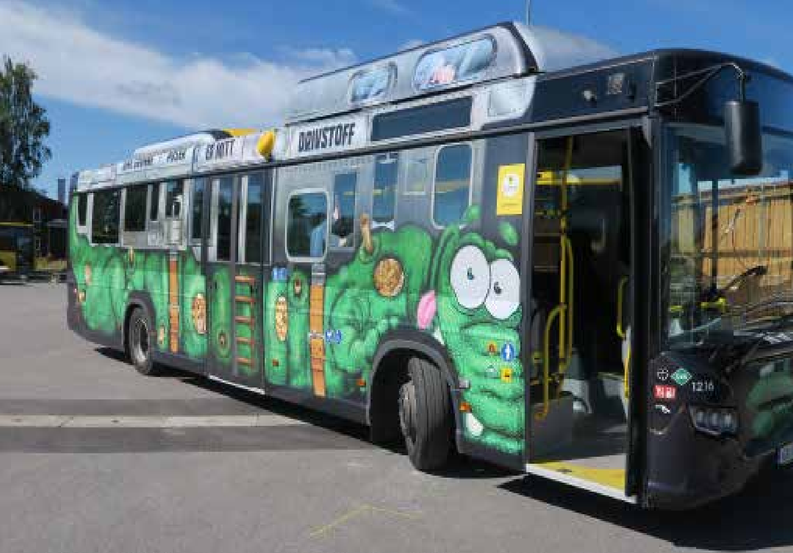
BUSSER: Biogass egner seg svært godt som drivstoff på busser.