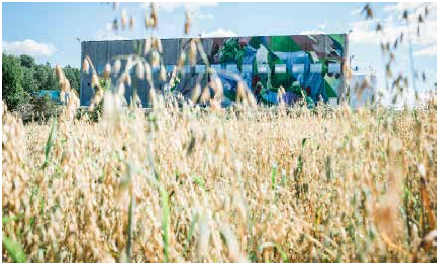
DEN MAGISKE FABRIKKEN: Den magiske fabrikken i Tønsberg produserer biogass og biogjødsel av matavfall og husdyrgjødsel innsamlet i Vestfold.

En biogassbuss kan kjøre 500 meter på to kg matavfall.