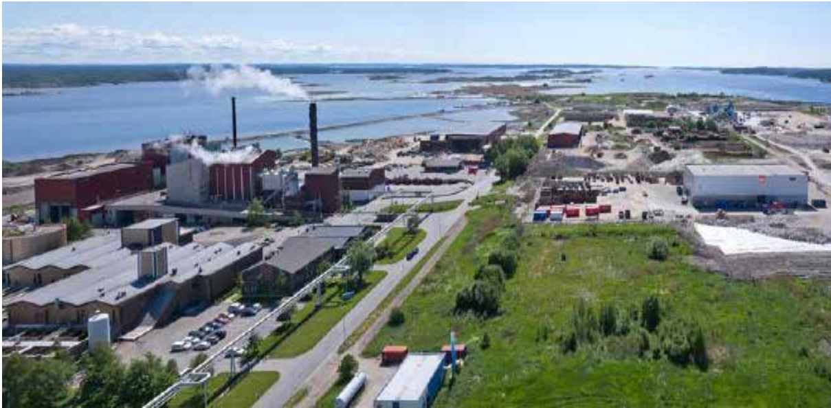
FREDRIKSTAD: Frevar i Fredrikstad er et av de første anleggene for produksjon av biogass som ble bygget her i landet.

Tar vi med bruk av jomfruelige ressurser som tang, tare og alger og distribuerer dette til produksjon av biogass er potensialet enda høyere.