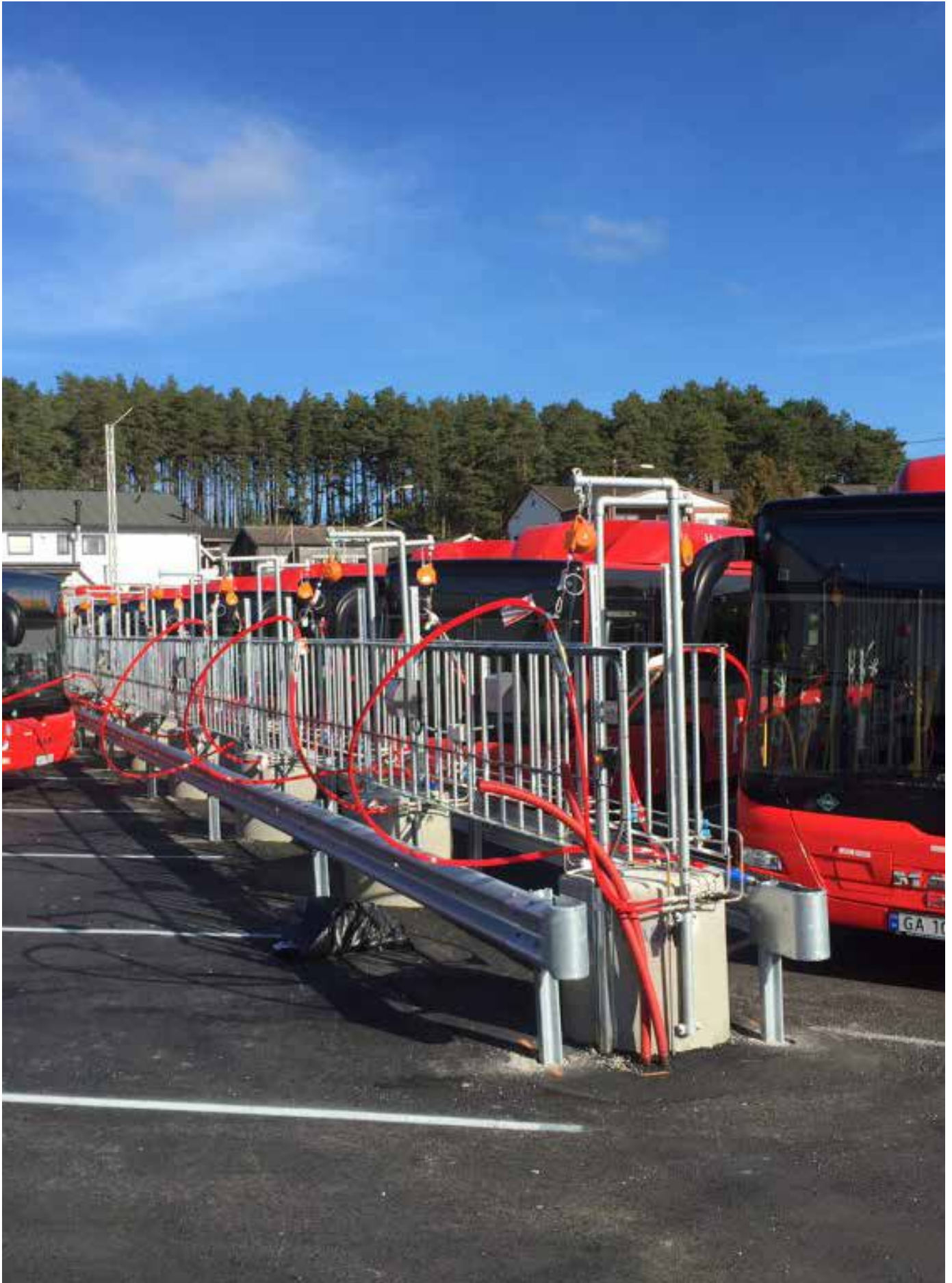
FREDRIKSTAD: Fylling av biogass på busser i Fredrikstad.