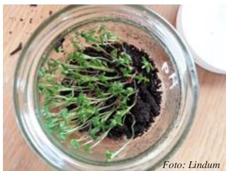
Figur 1 Spireforsøk med karse

Det er flere metoder for å sjekke spirehemmende effekt, men den enkleste metoden er å så vårbygg, karsefrø ( se Figur 1 og Figur 2) eller gressfrø, og sammenlikne kompostprøven mot en kontrolljord. Dette er en metode anleggene selv kan gjennomføre som en del av sluttkontrollen.