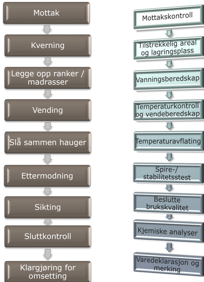
Figur 4 Prosessflyt i kompostprosessen til venstre og kontrollregimer til høyre

I utgangspunktet gjennomføres normalt alltid kompostering utendørs. Lukkede systemer vil være for kostbare med denne type råvare. Komposteringen skal skje på tette flater, asfalt, slik at man ikke risikerer å blander "undergrunnen" inn i ranken ved vending. Som en tommelfingerregel tar det mellom ett og to år fra mottak av hageparkavfall til komposten er ferdig for omsetting.