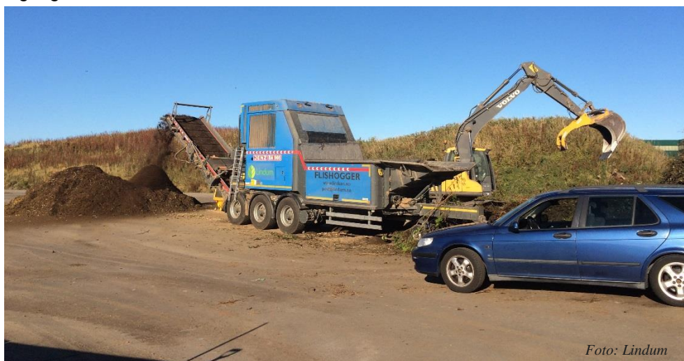
Figur 6. Kverning av hageavfall.

Hage-/parkavfallet må kvernes før kompostering (Figur 6). Kverningen homogeniserer og finfordeler avfallet for å gi det best mulig utgangspunkt for kompostering. Da kverner er kostbart, er det vanlig at entreprenører med utstyr leies inn. Det må da tas stilling til om det er behov for å kverne ofte eller i kampanjer (mye i en kortere periode). En bestilling må spesifiseres og avtales med tonnpris. Det må også avtales hvor fint det skal kvernes, slik at man får rett struktur til komposteringen. For en innleid entreprenør vil det alltid lønne seg å kverne grovt siden dette tar kortest tid. Dersom råvaren/ hage-/parkavfallet ikke kan kvernes opp fortløpende, er det viktig med tilstrekkelig areal for mellomlagring av råvarer. Som ukvernet råvare er det lite sannsynlig at det starter å kompostere under lagring.