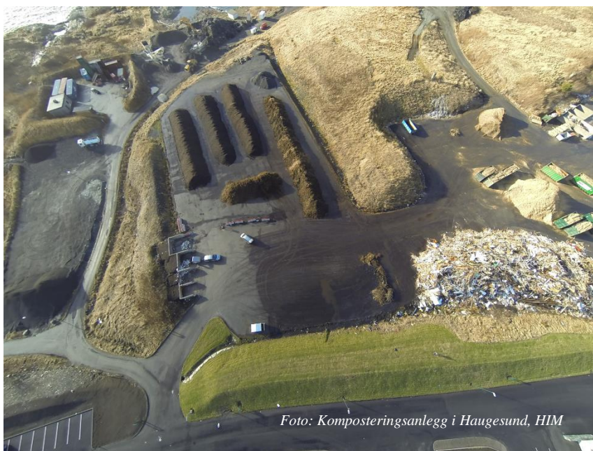
Foto: Komposteringsanlegg i Haugesund

Veiledningen har som formål å sette anleggseiere i stand til å forstå hva som må til for å øke markedsverdien til hageavfallskompost, herunder kontroll og oppfølging gjennom hele produksjonsprosessen og forstå hva som menes med rett kvalitet til ulike bruksområder. En annen viktig aspekt med veilederen er å gi grunnlag for kommuner og private avfallseiere til å kunne anskaffe kvalitetsmessig god behandling av sitt park- og hageavfall i tråd med gode miljø- og kvalitetsstandarder.