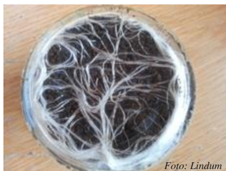
Figur 2 Spireforsøk med karse, god rotutvikling.