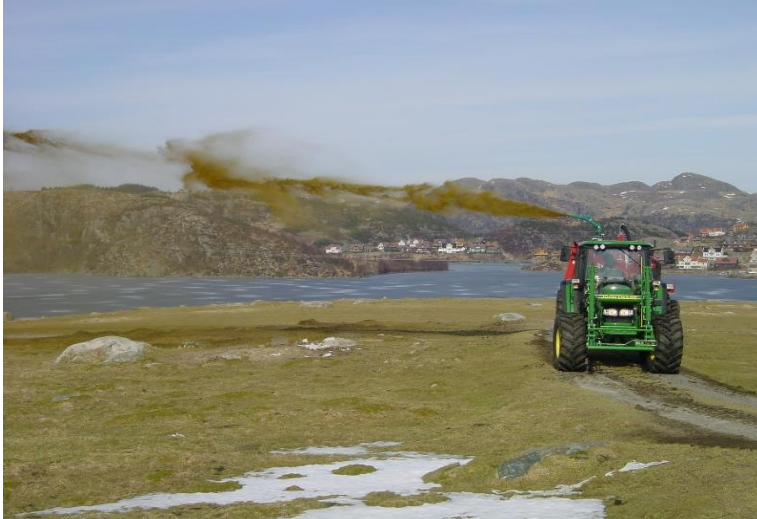
Kanonspredning (jetvogn) kan gi avdrift over store avstander.