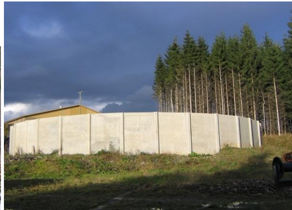
Gjødsellager i stål og i betong