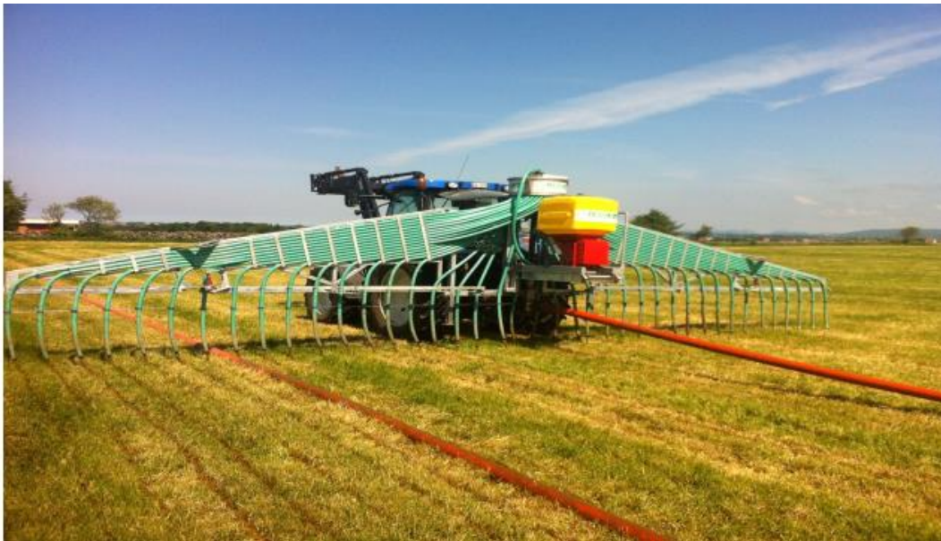
Slepeslange med stripenedlegger

Skåler eller kniver som åpner opp i overflate og legger gjødsla ned i bakken. Dette utstyret har lite for seg i voksende kulturer. Skaden på planterøttene og oppriving av stein blir ofte større enn nytten av å få noe av gjødsle ned i bakken.